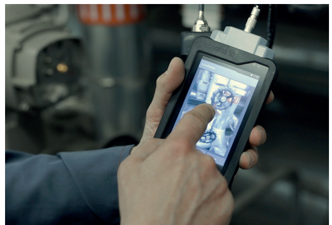
Nach der Aufnahme von Temperatur und Ultraschall werden Fotos, Sprachmemos und Kommentare zu jedem Prüfpunkt hinzugefügt.

nach dem Wechsel der ersten Ableiter deutlich nach unten“, berichtet der Energiebeauftragte. Zukünftig sollen im Peniger Werk alle Kondensatableiter erfasst und regelmäßig überprüft werden. Die planmäßige vorbeugende Instandhaltung sieht vor, den Zustand der Ableiter halbjährlich zu überwachen. Außerdem plant das Team das SONAPHONE auch für weitere Instandhaltungsaufgaben einzusetzen. So können mit dem digitalen