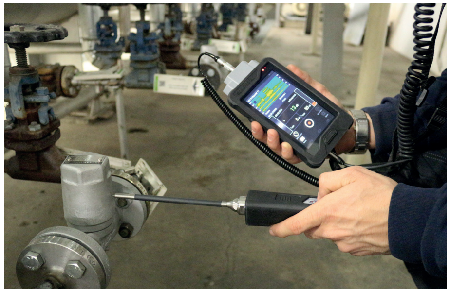
Aufnahme des Ultraschallsignals im Frequenzbereich von 20 bis 100 Kilohertz mit dem breitbandigen Körperschallsensor. Die Geräuschcharakteristik von defekten Kondensatableitern unterscheidet sich auf den ersten Blick von der Charakteristik intakter Ableiter.