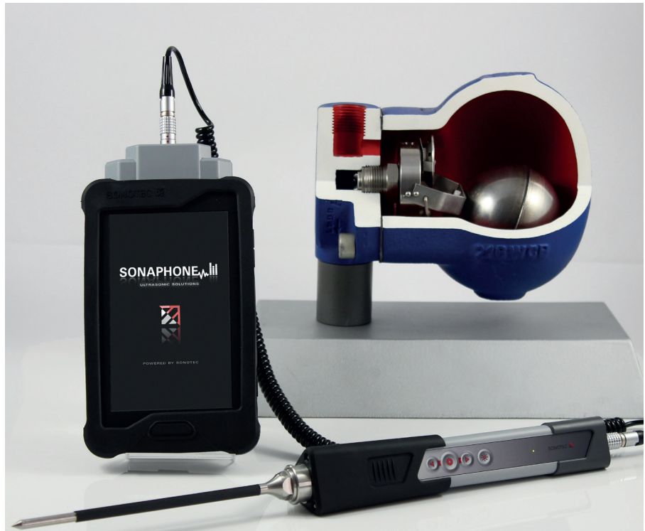
Bei der Prüfung der Kondensatableiter wurden die Energie-Scouts mit Technik aus dem Hause SONOTEC unterstützt. Arbeitet der Kondensatableiter korrekt oder ist er defekt? Das digitale Ultraschallprüfgerät SONAPHONE lieferte die Antwort auf diese Frage.

Ein Teilbereich mit 28 thermischen und Schwimmerableitern sollte analysiert werden. Hierfür wurden alle Kondensatableiter im Gerät erfasst