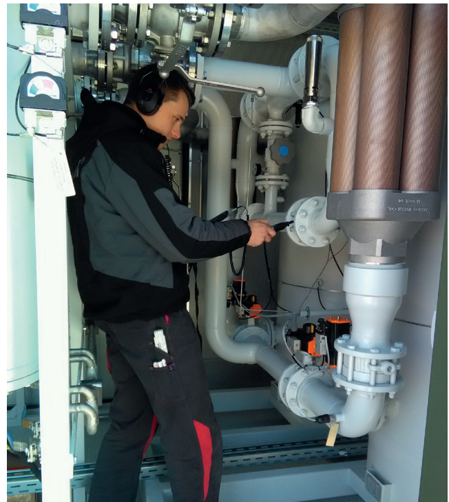
Dichtheitsprüfung durch die apikal Anlagenbau GmbH nach Abschluss der Installationsarbeiten an einer Druckluftcontainerstation