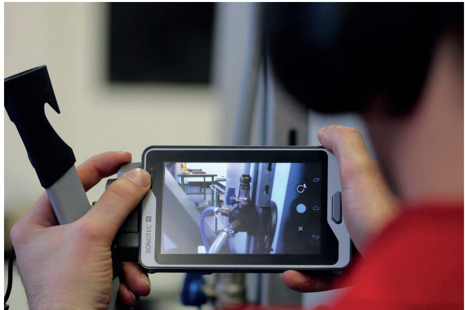
Mit der integrierten Kamera können Bilder der Leckage aufgenommen werden

Außerdem besteht die Möglichkeit Sprachmemos und Kommentare zum Leck hinzuzufügen. Weitere Details, wie die Position der Leckage, die Priorität und Reparaturhinweise können zusätzlich ergänzt werden. Die digitale Kurzbeschreibung der Leckage ist schnell erstellt und Herr Müller sucht schon die nächste Leckstelle.