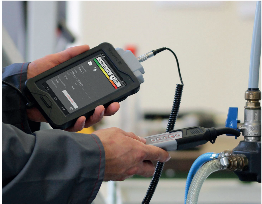
In der näheren Umgebung der Leckage gibt der Feinsucher Aufschluss über die genaue Lage und die ausströmende Druckluftmenge

Nach dem der Bereich grob eingegrenzt wurde, geht es an die genaue Lokalisierung der Schadstelle. Hierfür wird der Aufsatz Feinsucher auf den Luftschallsensor gesteckt. Mit diesem