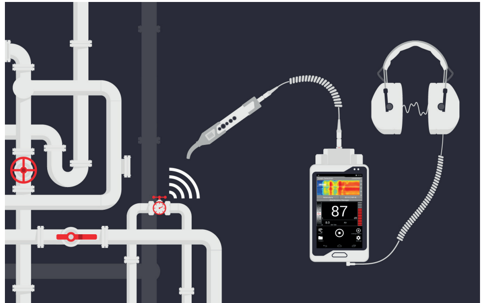
Das intuitiv bedienbare Ultraschallprüfgerät SONAPHONE® mit LeakExpert®-App ortet, bewertet und klassifiziert Druckluftleckagen

Ausgestattet mit drei verschiedenen Aufsätzen können mit dem Sensor Leckagen auf Entfernungen bis zu 8 Metern detektiert werden. Für noch größere Entfernungen bietet SONOTEC® den Sensor BS30 an. Mit dem Parabol-sensor können sogar Leckagen auf Entfernungen bis zu 25 Metern aufgespürt werden.